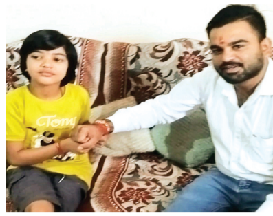
हरिभूमि न्यूज | ललितपुर